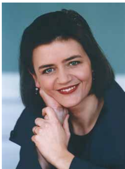
Margrethe Vestager: »Der er en indlysende frygt for, at magtanvendelse sættes i stedet for menneskeligt nærvær«.

»Det er meget afgørende, at lovgivningen ikke får lov til at stå alene. Hvad gør vi inden problemerne opstår? Hvilken uddannel-